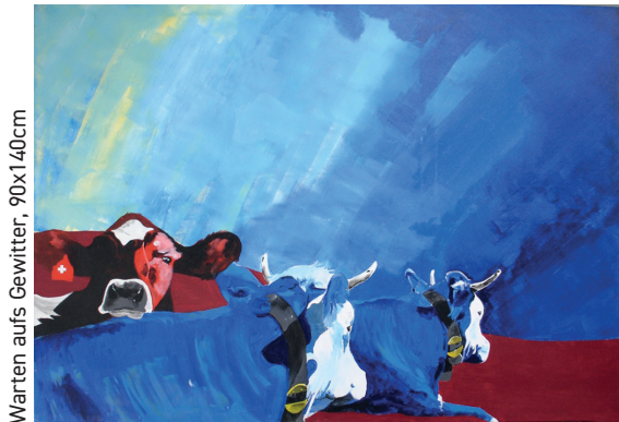
Warten aufs Gewitter, 90x140cm