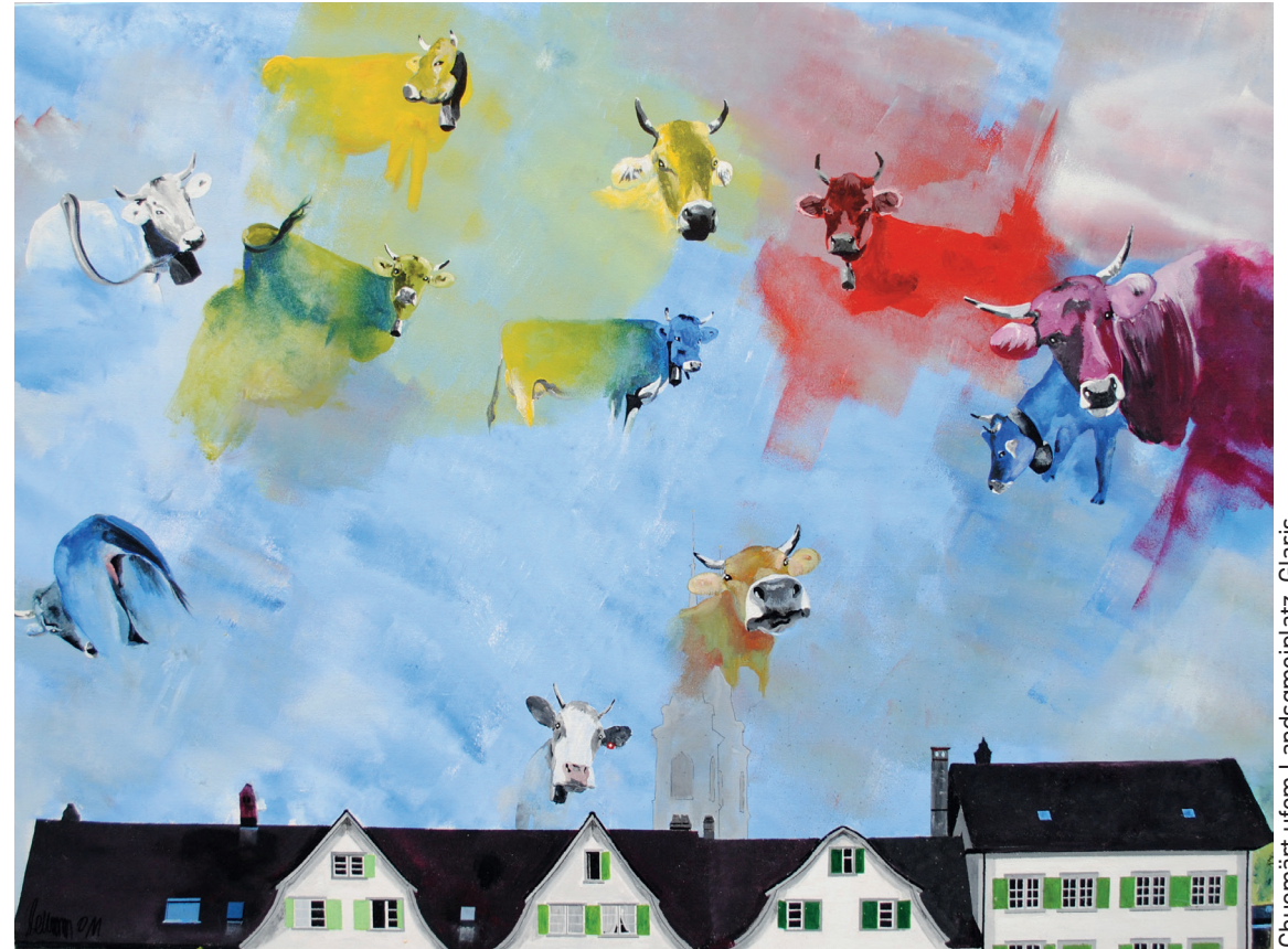
Chuemärt ufem Landsgmeiplatz, Glaris